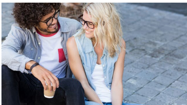
Kom meer te weten over veraf- en leesbrillen