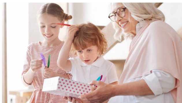
Multifocale brillenglazen: alles wat u dient te weten