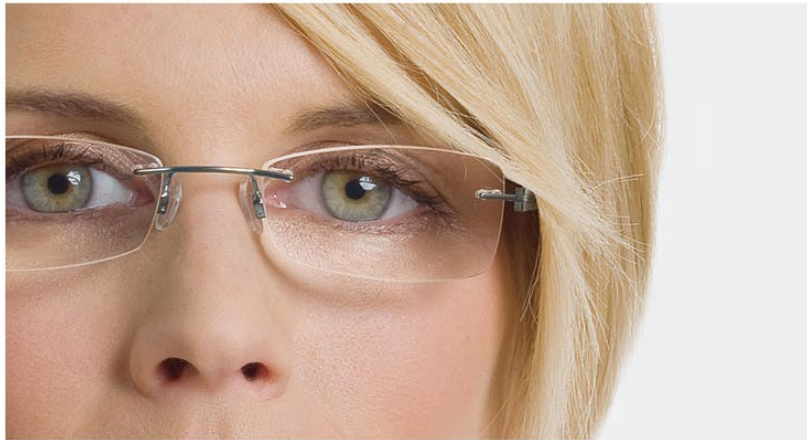
Negatief effect van uitpuilende ogen.

Breng de oogschaduw aan vanaf de binnenhoek van het oog naar buiten toe, en blijf daarbij binnen de plooi van het ooglid. Gebruik een donkere eyeliner of potlood om de rand van het ooglid te benadrukken. Hierdoor lijken uw ogen kleiner. Wees erg voorzichtig met het aanbrengen van make-up omdat verkeerd aangebrachte make-up extra goed zichtbaar is vanwege de uitvergroting. Wees spaarzaam bij het aanbrengen van mascara op de bovenste wimpers en gebruik weinig tot geen mascara op de onderste wimpers.